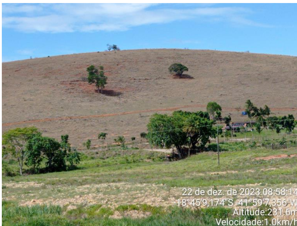
Figura 2: Pastagem seca e área preparada para o plantio.