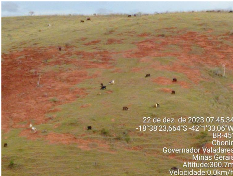
Figura 1: Área com redução de pastagem.