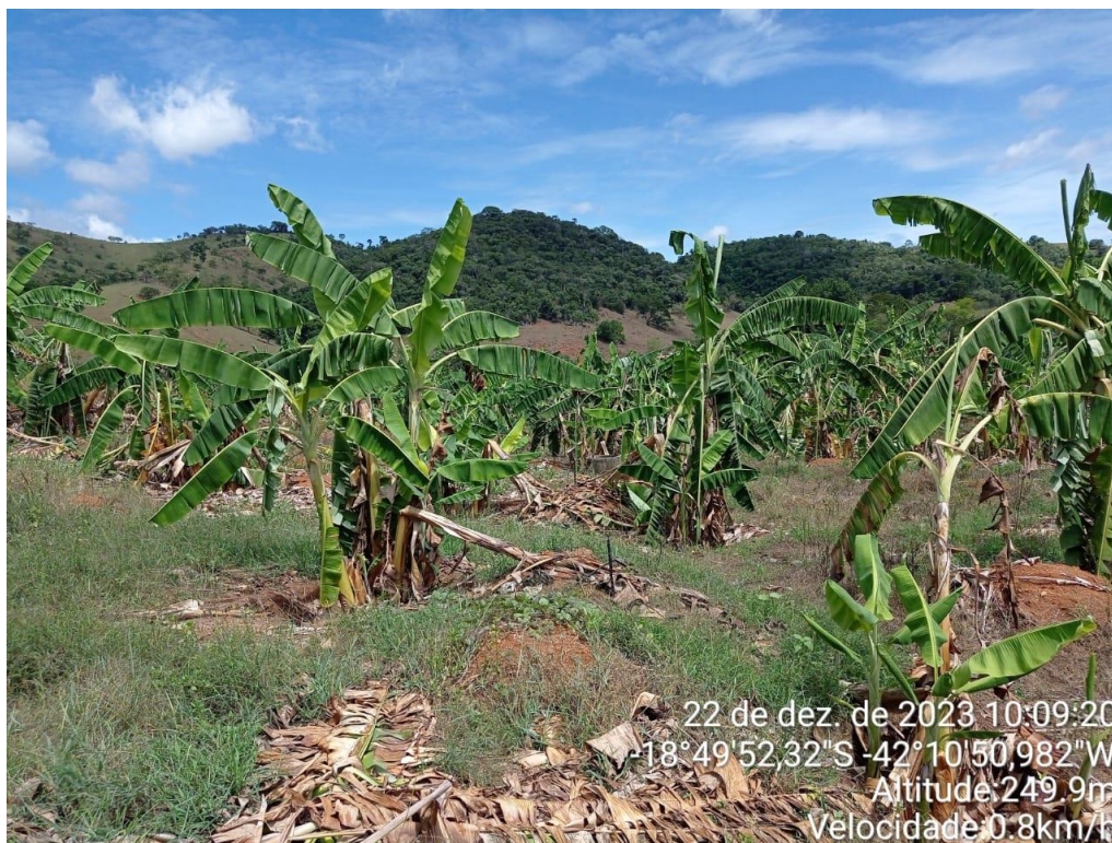
Figura 10: Plantação de banana.