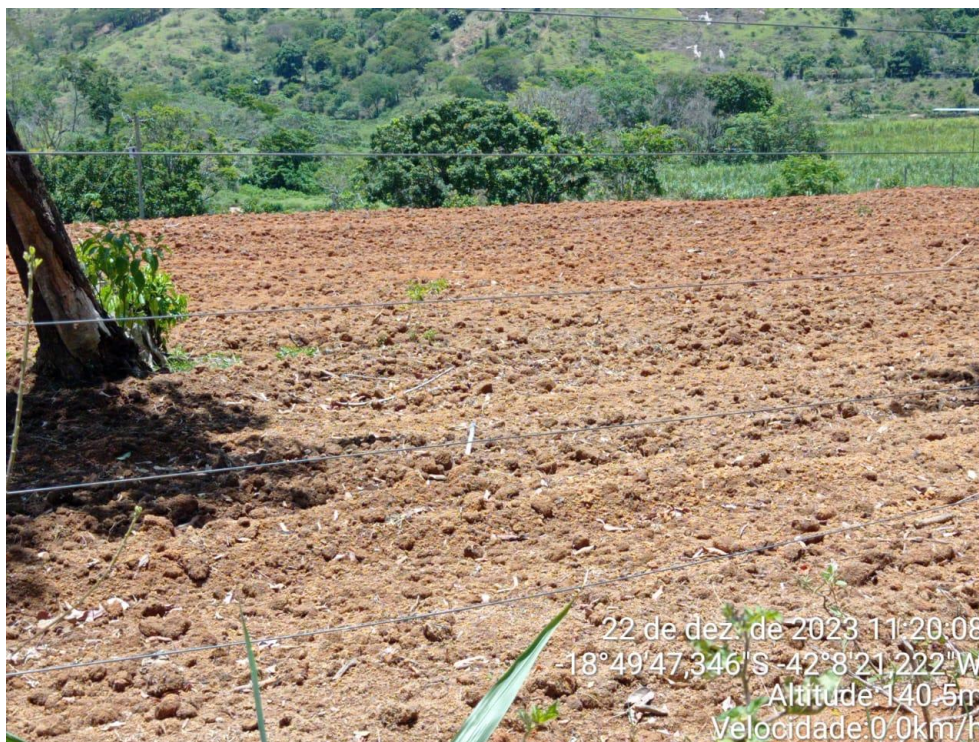
Figura 3: Área preparada para o plantio de milho.