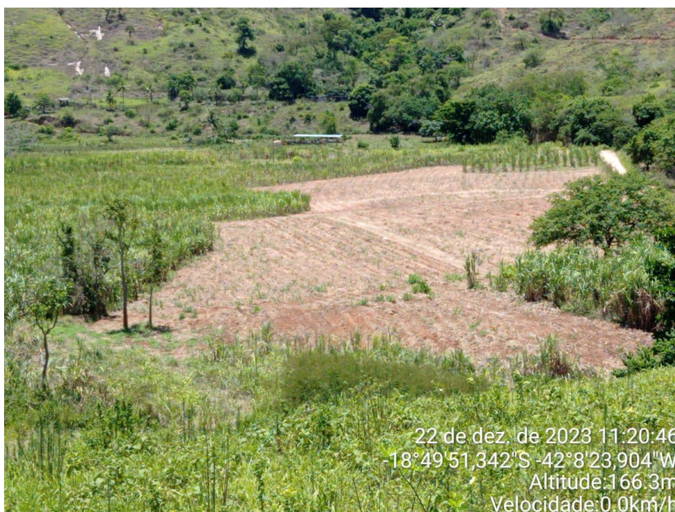
Figura 7: Área para cana de açúcar.