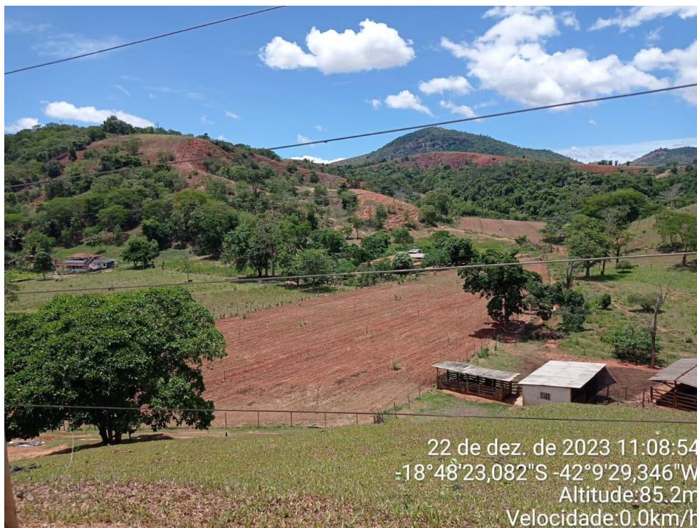
Figura 6: Área para o plantio de milho e área de pastagem.