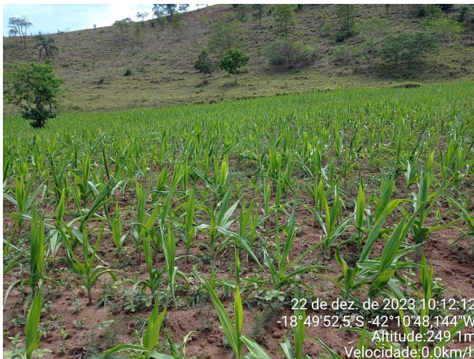
Figura 8: Plantio de milho, com 90 dias.