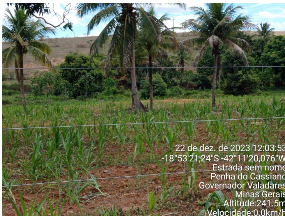
Figura 4: Plantio de milho.