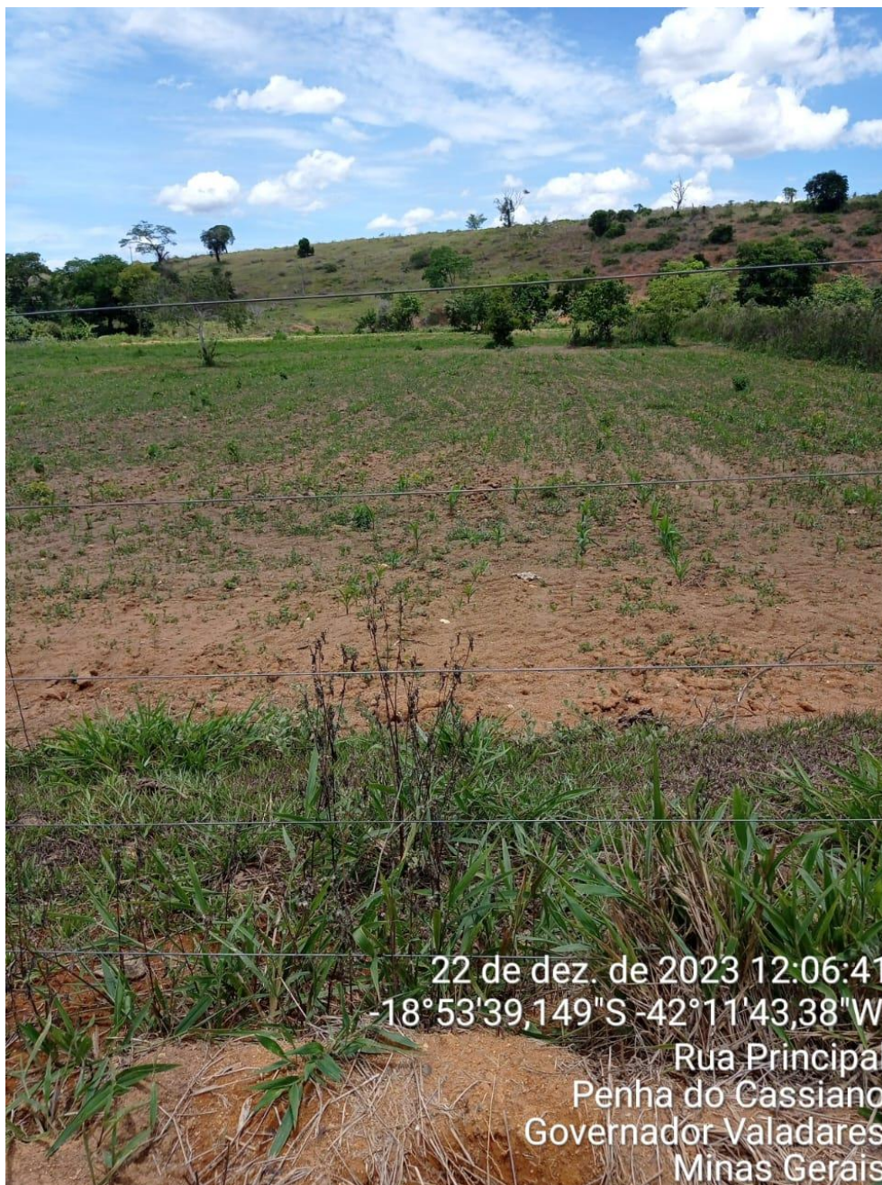
Figura 5: Área preparada para o plantio de milho.